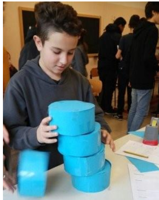
Ricerca della condizione di equilibrio instabile .