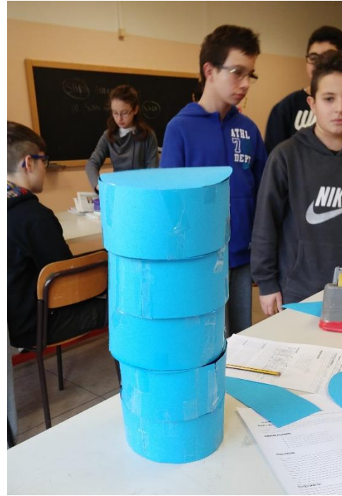
Condizione di equilibrio stabile .