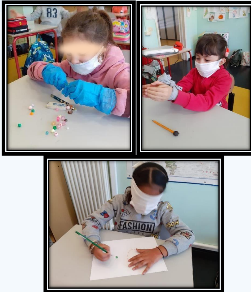
SPERIMENTIAMO ALCUNE DISABILITÀ...