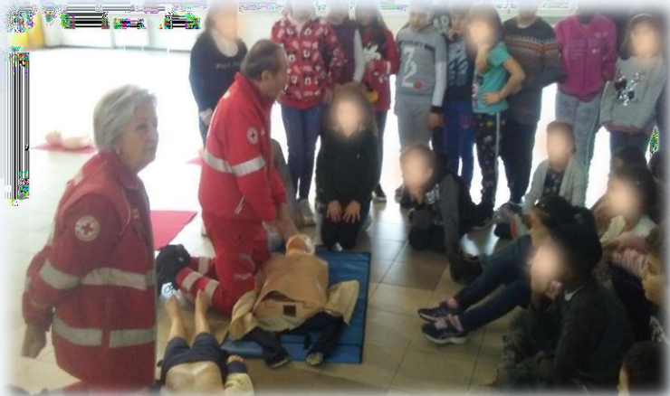
SOCCORRITORI IN ERBA (CROCE ROSSA ITALIANA)