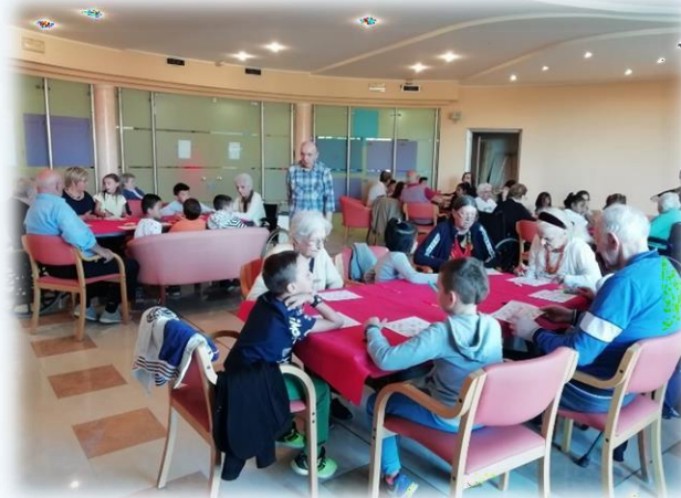
ATTIVITÀ CON LE CASE DI RIPOSO...