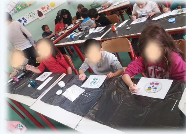
... CON LE COOPERATIVE