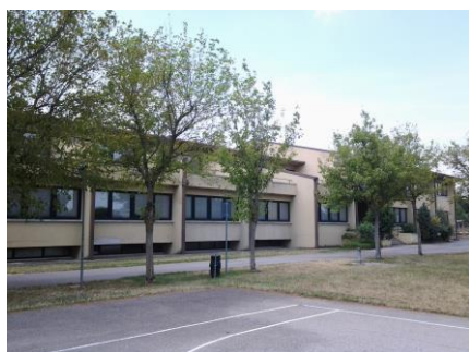
Scuola Secondaria di grado Don Milani