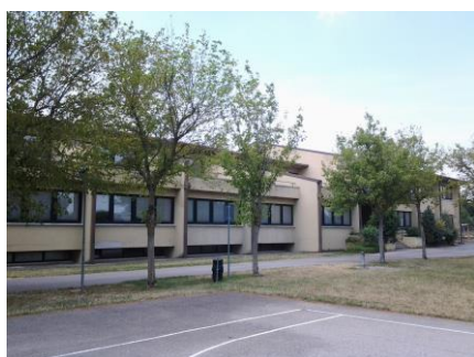
Scuola Secondaria di grado Don Milani