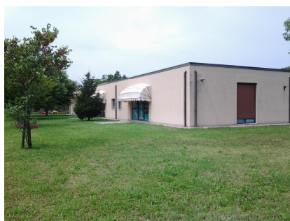
Scuola dell'Infanzia San Pietro