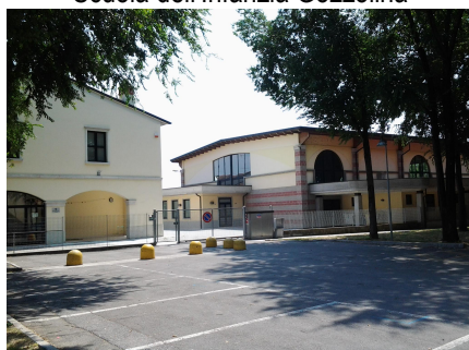
Scuola Primaria Gozzolina