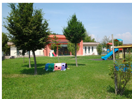
Scuola dell'Infanzia Gozzolina