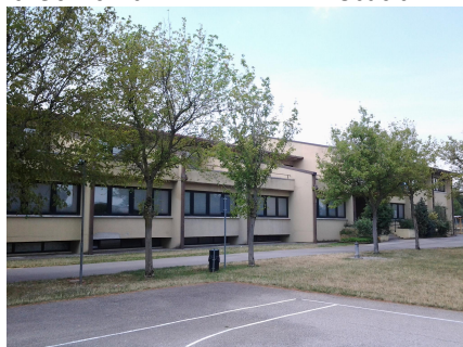
Scuola Secondaria don Milani